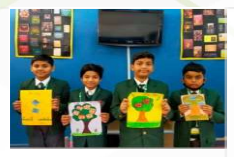
The Title Tree (Classes – III to V)