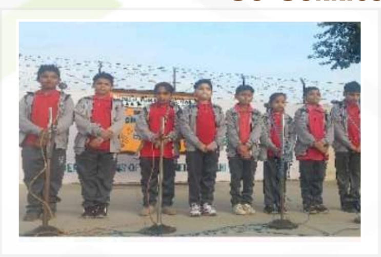
Group Song Competition (Classes – III to V)