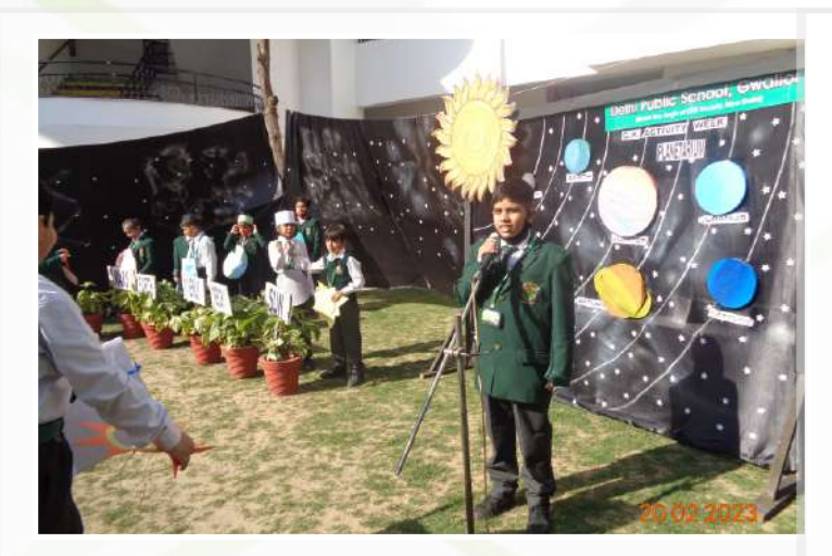
Know your Planet (Classes – III to V)