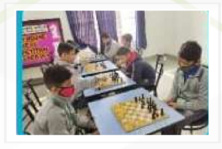
Chess Competition (Classes III to V)