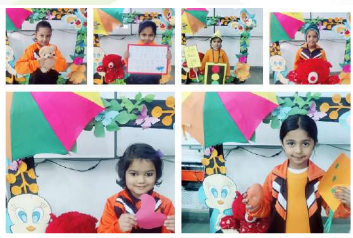
English Recitation (Class-Nursery)