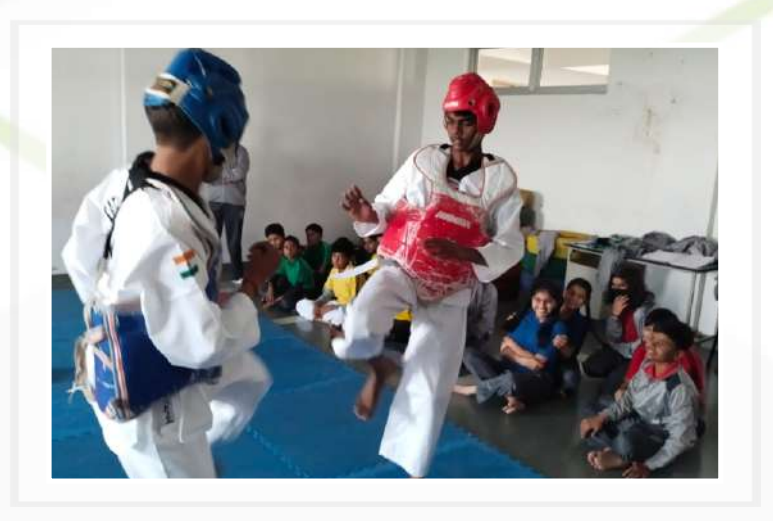
Taekwondo (Classes VI to VIII)