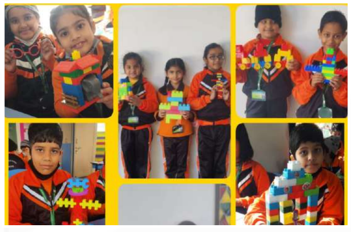
Creative Blocks (Class-II)