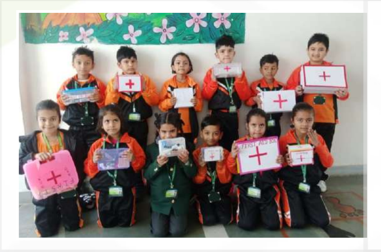
Safety Safe Together (Class-I)