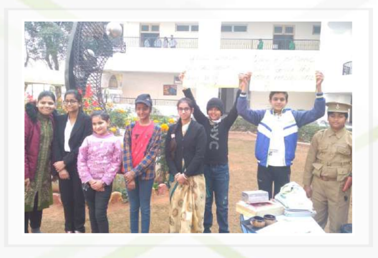
Drama Competition (Classes – VI to VIII)