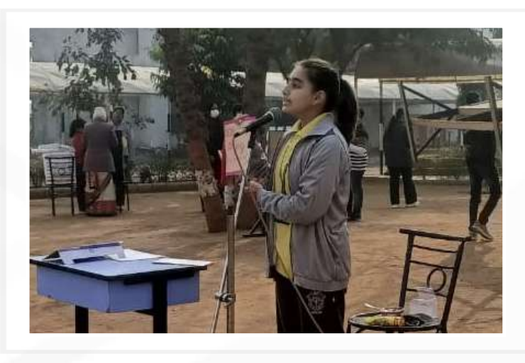
Advertisement Competition (Classes - VI to VIII)