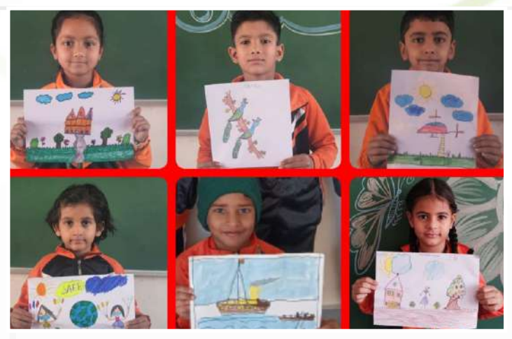
Drawing Fun (Class-I)