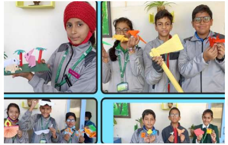
Art & Craft Origami (Classes – III to V)