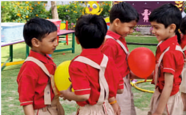
Introduction Party Fun Games (UKG)