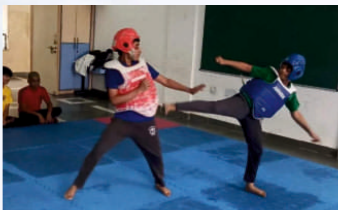
Taekwondo (Class VI-VIII)