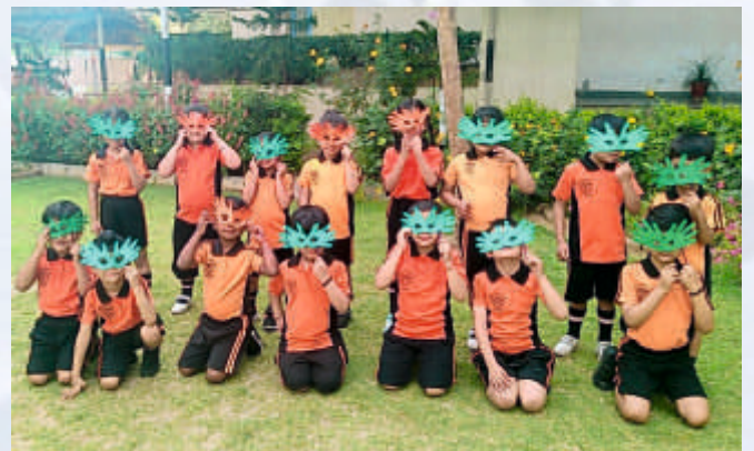
Hands on Mask (UKG)