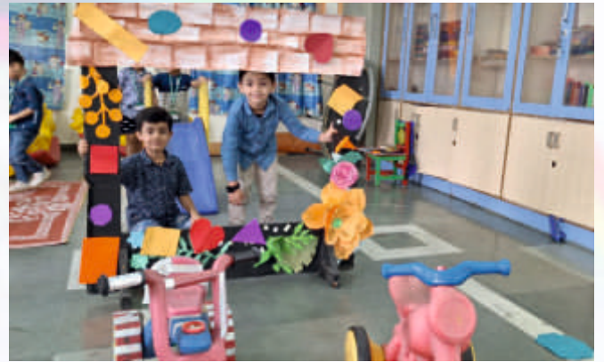
Fun with Shapes (UKG)