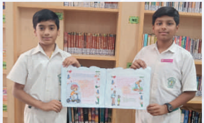
Comic Book (Class VI-VIII)