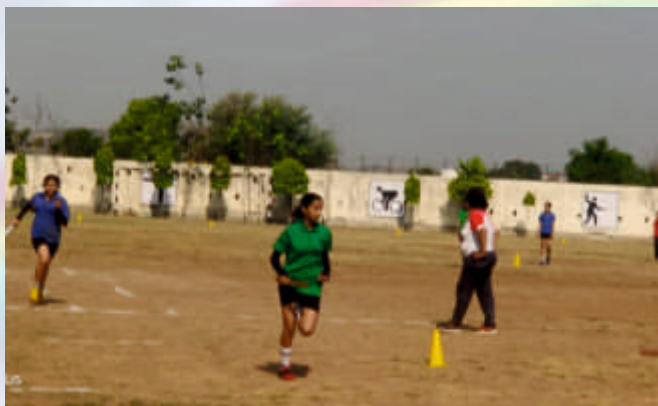
Relay Baton (Class VI-VIII)