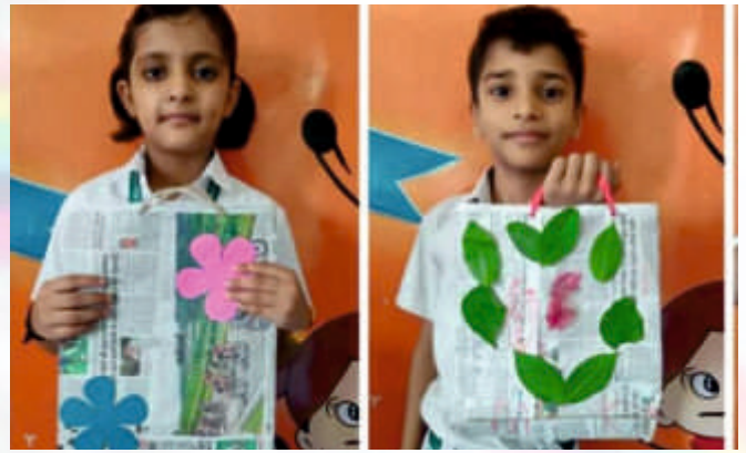
Paper Bag (Class I-II)