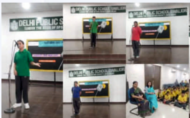
Hindi Declamation (Class IX-X)