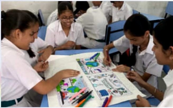
Poster Making (Class VI-VIII)