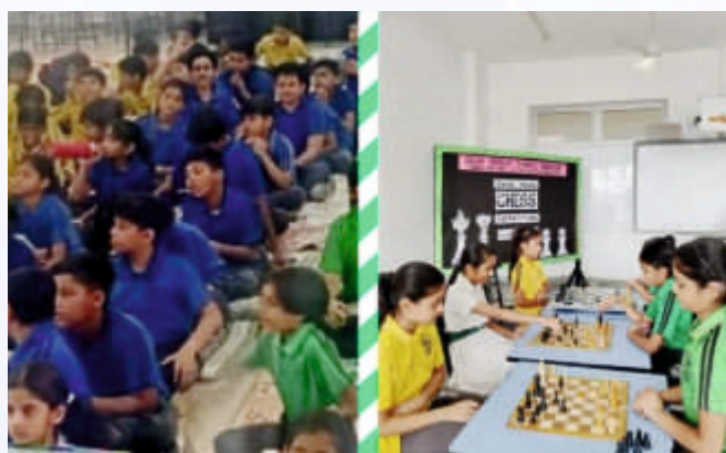
Chess (Class IX-X)