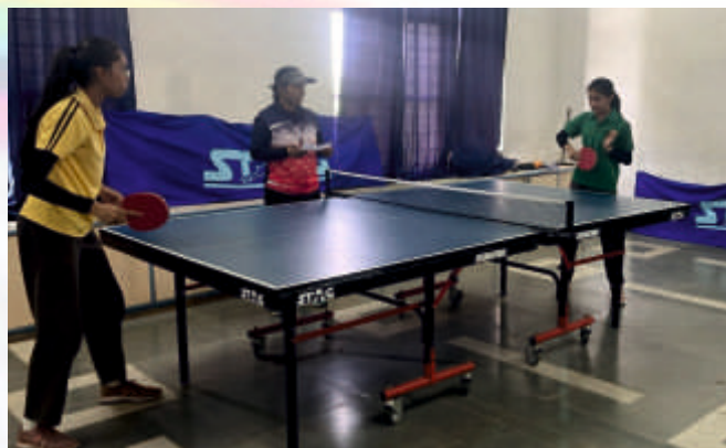
Table Tennis (Class VI-VIII)