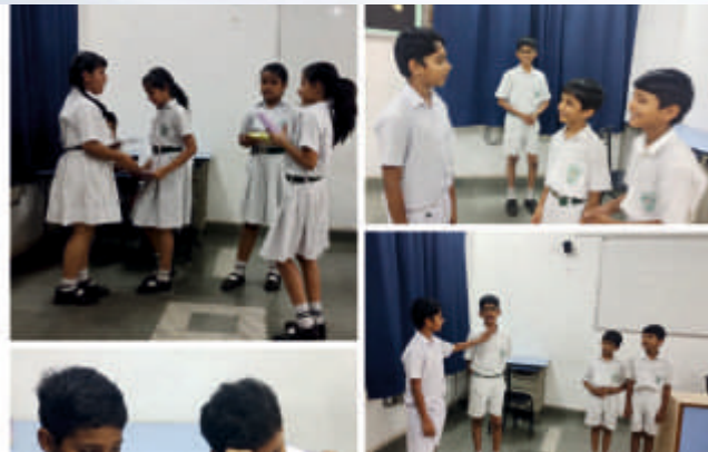
Role Play (Class III-V)