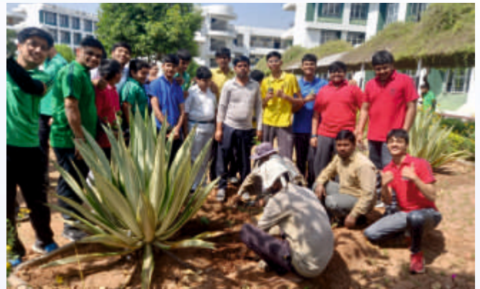
Plantation Drive (Class IX-X)