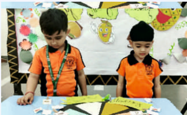
My Healthy Platter (LKG)