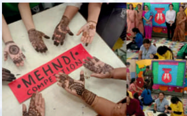
Mehndi (Class IX-X)