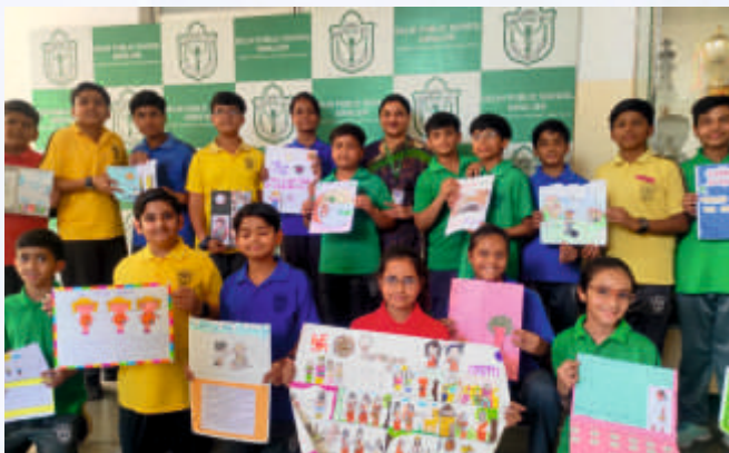
Illustration of the Story (Class VI-VIII)