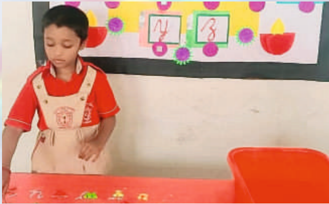
Floating Letters (UKG)