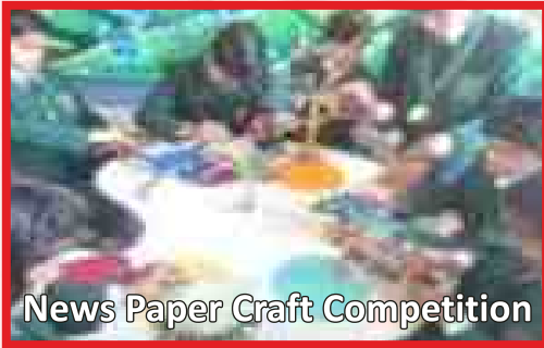
News Paper Craft Competition