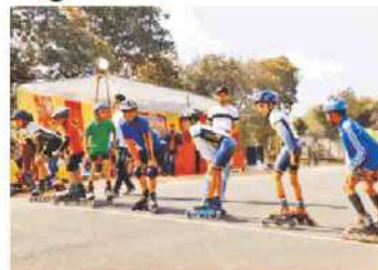
इंटर स्कूल स्केटिंग प्रतियोगिता में मारी बाजी।

द गवालियर डिजिटल गैलरी में 27 फोटोग्राफ प्रदर्शन जेट स्केटिंग के तत्वावधान में आयोजित हो दिवसों इस सप्ताह का शुभारंभ मुख्य अतिथि प्रवेश समारोह किए बिना शुरू हो जाएगा।