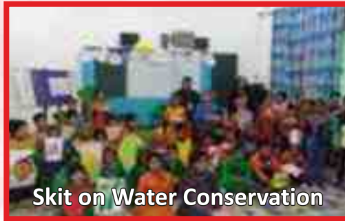
Skit on Water Conservation