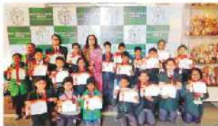
ग्वालियर के डीपीएस के छात्रों के हिंदी ओलंपियाड में प्रतिस्पर्धात्मक प्रदर्शन के लिए...