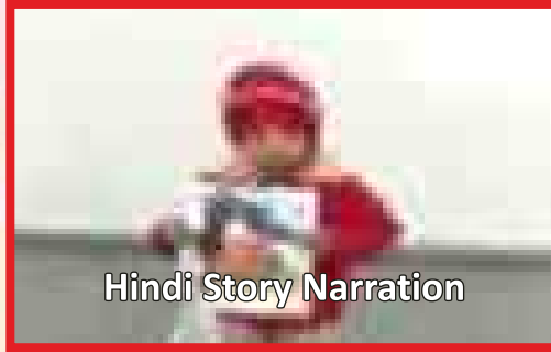
Hindi Story Narration