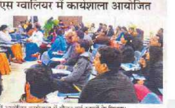
स्कूल में आयोजित कार्यशाला में मौजूद कई स्कूलों के शिक्षक।

ग्वालियर - देहली पब्लिक स्कूल ग्वालियर में सोबीएसई के तालाबन्धन में दो कार्यशाला का आयोजन हुआ। इसमें 51 सोबीएसई स्कूलों के शिक्षकों ने हिस्सा लिया। इसमें ऑफ लैंग्वीज और अरबिटी सोसायटी के सहयोग से हुई कार्यशाला में मोहिनीराष्ट्रिय ने संबोधन किया। साथ ही प्रधान के सान्ना लीकॉ के पर चर्चा की। इनमें कॉमिक स्ट्रिप और कॉम्प्यूटर गैमिंग शामिल रहा। अंत में एकसयद्वे द्वारा ऑनलाइन पाठशाला कार्यक्रम शुरू पर भी चर्चा की गई।