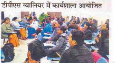
स्कूल में आयोजित कार्यशाला में मौजूद कई स्कूलों के शिक्षक।

ग्वालियर - देहली पब्लिक स्कूल ग्वालियर में सोबीएसई के तालाबन्धन में दो कार्यशाला का आयोजन हुआ। इसमें 51 सोबीएसई स्कूलों के शिक्षकों ने हिस्सा लिया। इसमें ऑफ लैंग्वीज और अरबिटी सोसायटी के सहयोग से हुई कार्यशाला में मोहिनीराष्ट्रिय ने संबोधन किया। साथ ही प्रधान के सान्ना लीकॉ के पर चर्चा की। इनमें कॉमिक स्ट्रिप और कॉम्प्यूटर गैमिंग शामिल रहा। अंत में एकसयद्वे द्वारा ऑनलाइन पाठशाला कार्यक्रम शुरू पर भी चर्चा की गई।