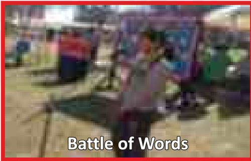
Battle of Words