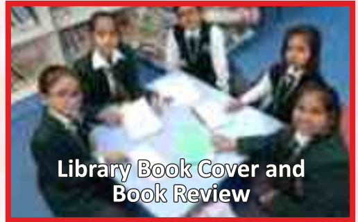
Library Book Cover and Book Review