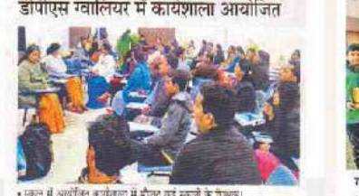
स्कूल में आयोजित कार्यशाला में मौजूद कई स्कूलों के शिक्षक।

ग्वालियर - देहली पब्लिक स्कूल ग्वालियर में सोबीएसई के तालाबन्धन में दो कार्यशाला का आयोजन हुआ। इसमें 51 सोबीएसई स्कूलों के शिक्षकों ने हिस्सा लिया। इसमें ऑफ लैंग्वीज और अरबिटी सोसायटी के सहयोग से हुई कार्यशाला में मोहिनीराष्ट्रिय ने संबोधन किया। साथ ही प्रधान के सान्ना लीकॉ के पर चर्चा की। इनमें कॉमिक स्ट्रिप और कॉम्प्यूटर गैमिंग शामिल रहा। अंत में एकसयद्वे द्वारा ऑनलाइन पाठशाला कार्यक्रम शुरू पर भी चर्चा की गई।