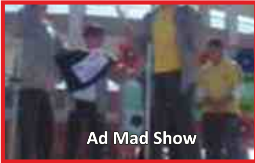
Ad Mad Show